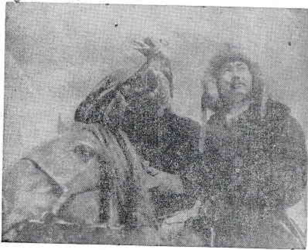
فارس من فرسان «الغازق» وقد استعد للصيد

هناك في قلب آسيا بين القارة الصينية المترامية في الشرق ومجاهل سيريا في الشمال وبلاد ما وراء «أورال» في الغرب نشأ الشعب التركستاني