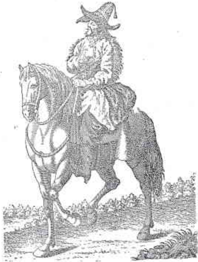
فارس من فرسان قيرغيز الرحالة

والزئك والنحاس والقصدير والذهب والفضة والكبريت والصوديوم والوفرام كما اكتشف الفحم الحجري بوفرة وكذلك البترول حول « امبا » واستناداً إلى ما جاء في تقرير الخبراء (١) فإن هذه المنطقة تحتوي على ١٢٩٠ مليون طن من الزيت وكما جاءت في جريدة « قزويل » أزباكستان « فقد اكتشفت آبار جديدة للزيت على مقربة من انديجان وكاشغر . والعمل قائم هناك على قدم وساق لاستخراجه . وقد اكتشف أخيراً الراديوم واليورانيوم في مناطق « آلتاي » و « تشوشك » .